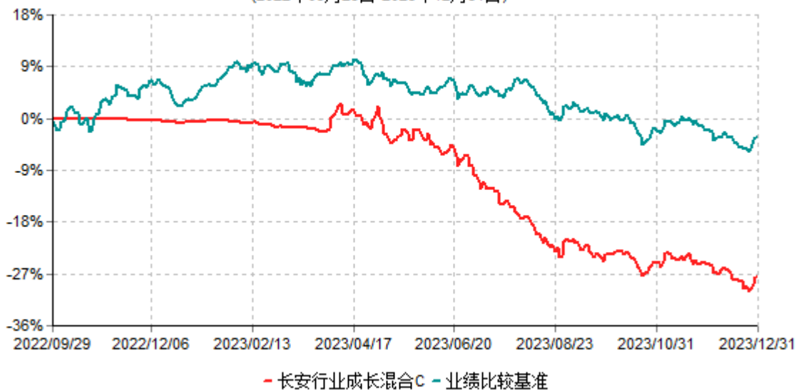
长安行业成长混合C累计净值增长率与业绩比较基准收益率历史走势对比图 (2022年09月29日-2023年12月31日)

根据基金合同的规定,自基金合同生效之日起6个月内基金各项资产配置比例需符合基金合同要求。本基金在建仓期结束后,各项资产配置比例已符合基金合同有关投资比例的约定。本基金于2022年9月29日成立,基金合同生效日至报告期末,本基金运作时间已满一年。图示日期为2022年9月29日至2023年12月31日。