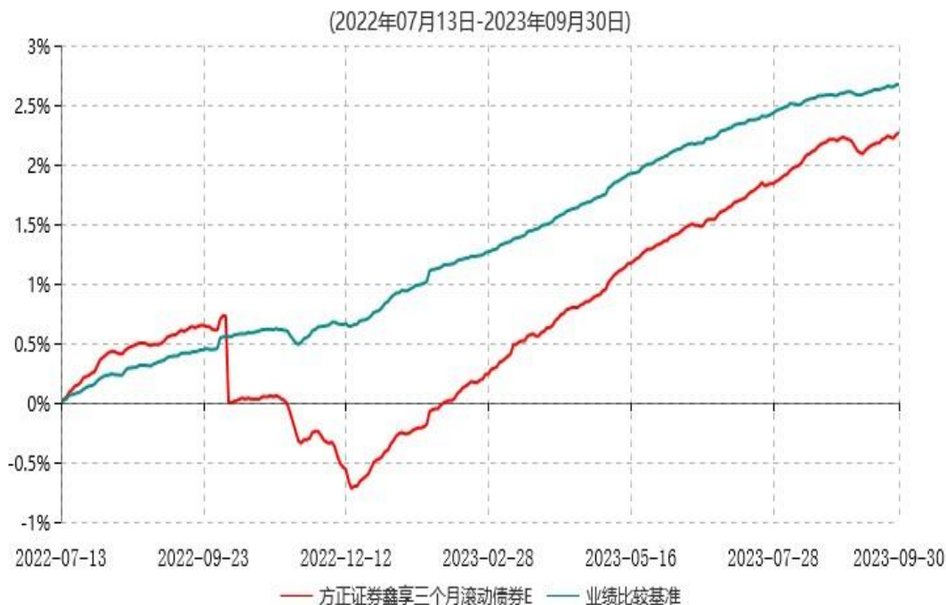
方正证券鑫享三个月滚动债券E累计净值增长率与业绩比较基准收益率历史走势对比图

注：1、基金合同生效日为 2022 年 5 月 25 日，方正证券鑫享三个月滚动债券 E 自 2022 年 7 月 1 日起开放申购和赎回业务，首个投资者于 2022 年 7 月 12 日提交申购申请。 2、本基金合同于 2022 年 5 月 25 日生效，建仓期 6 个月，截至报告期末本基金已完成建仓，建仓期结束时各项资产配置比例符合基金合同约定。 3、2022 年 10 月 13 日，对 E 类基金份额 10 月 12 日的赎回申请按照 1.0073 元进行确认，赎回确认后 E 类基金份额为 0。2022 年 10 月 17 日，对 E 类基金份额 10 月 14 日的申购申请按照 1.0000 元进行确认。