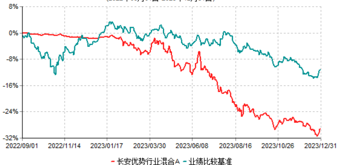
长安优势行业混合A累计净值增长率与业绩比较基准收益率历史走势对比图 (2022年09月01日-2023年12月31日)

根据基金合同的规定,自基金合同生效之日起6个月内基金各项资产配置比例需符合基金合同要求。本基金在建仓期结束后,各项资产配置比例已符合基金合同有关投资比例的约定。本基金于2022年09月01日成立,基金合同生效日至报告期末,本基金运作时间已满一年。图示日期为2022年09月01日至2023年12月31日止。