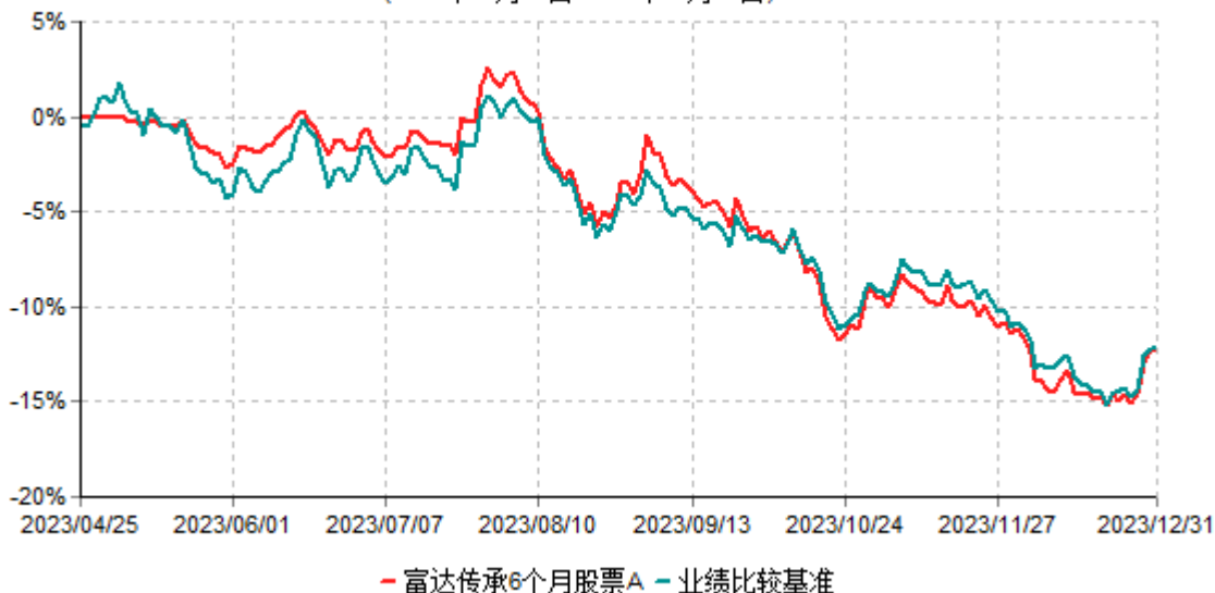
富达传承6个月股票A累计净值增长率与业绩比较基准收益率历史走势对比图 (2023年04月25日-2023年12月31日)