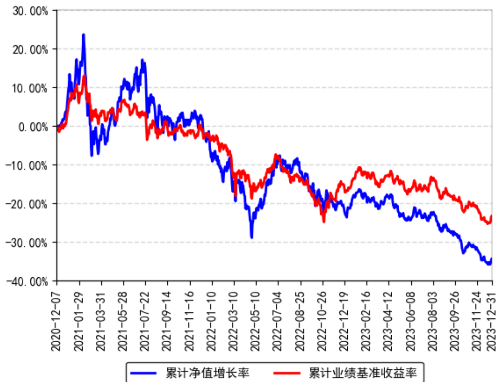
南方产业升级混合A累计净值增长率与同期业绩比较基准收益率的历史走势对比图