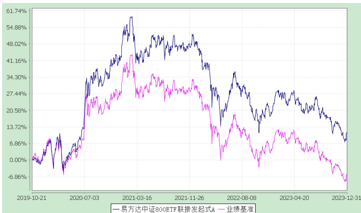
易方达中证 800ETF 联接发起式 C