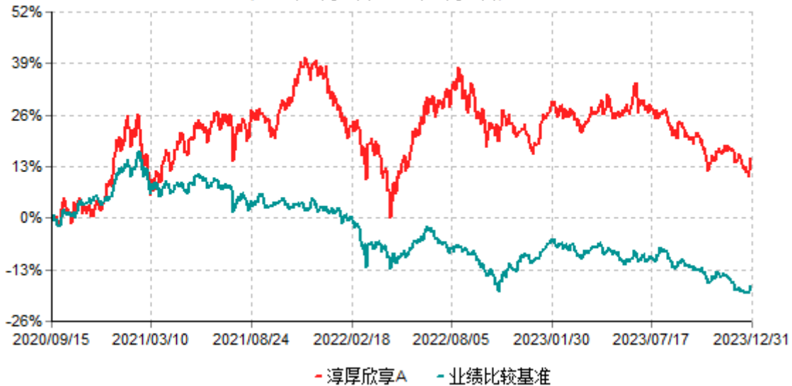
淳厚欣享A累计净值增长率与业绩比较基准收益率历史走势对比图 (2020年09月15日-2023年12月31日)

注：本基金基金合同生效日为2020年9月15日。按基金合同规定，本基金自基金合同生效起6个月内为建仓期。建仓期结束时本基金的各项投资比例均符合基金合同约定。