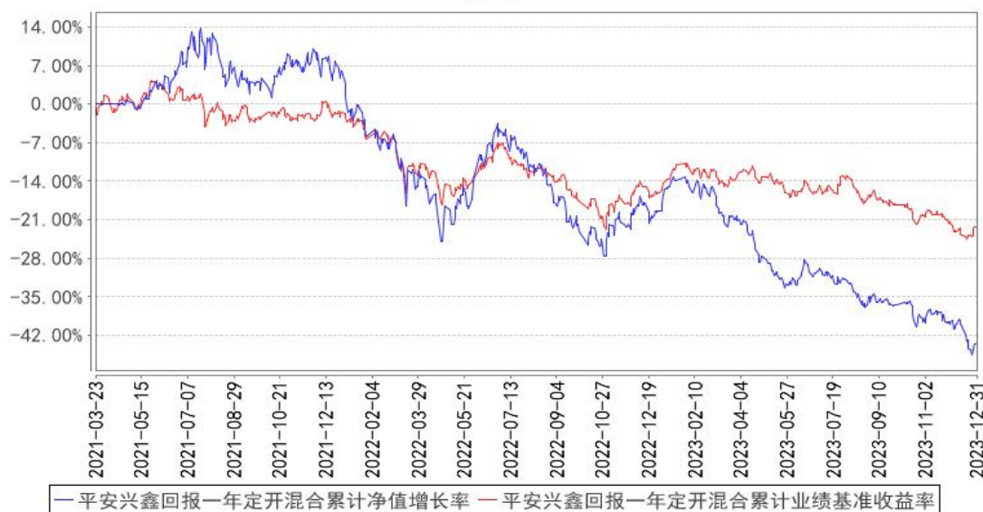
平安兴鑫回报一年定开混合累计净值增长率与同期业绩比较基准收益率的历史走势对比图