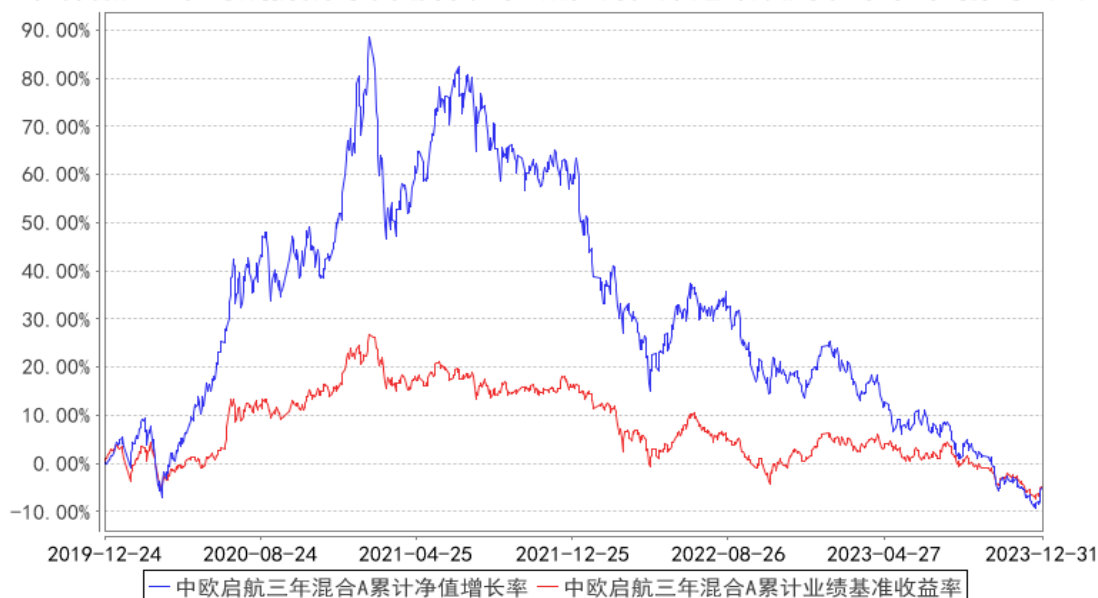
中欧启航三年混合A累计净值增长率与同期业绩比较基准收益率的历史走势对比图