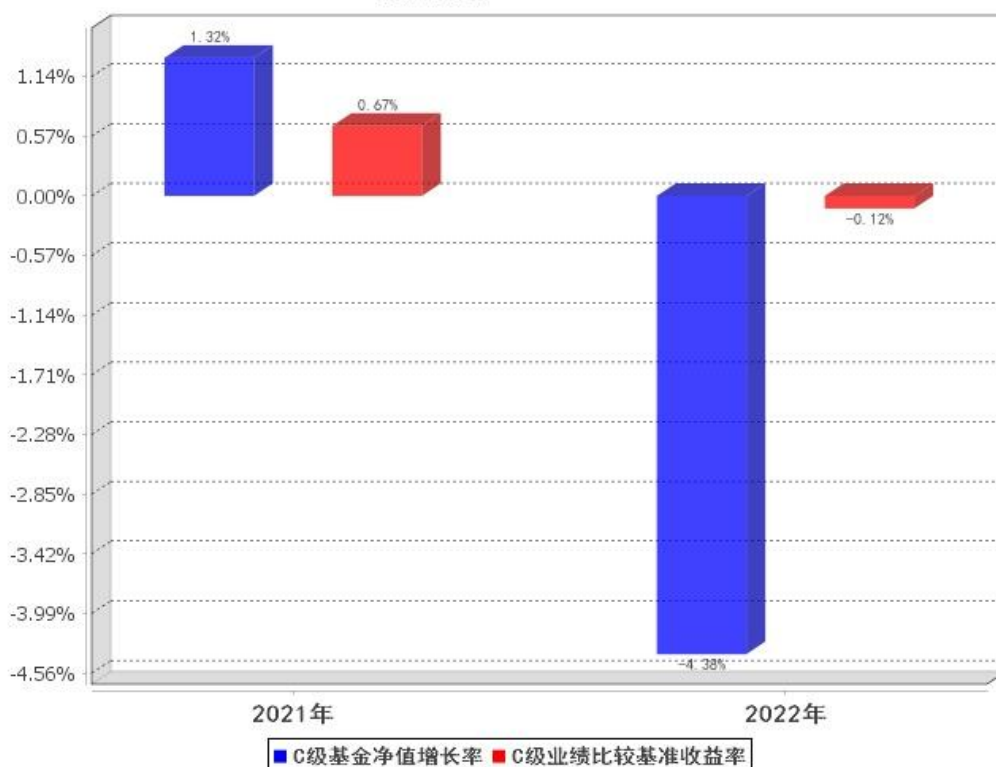
C级自基金合同生效以来基金每年净值增长率及其与同期业绩比较基准收益率的对比图 截止日期: 2022-12-31