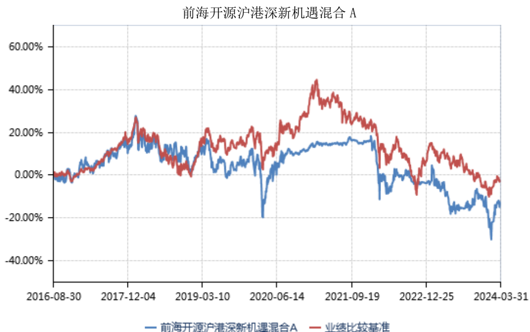
前海开源沪港深新机遇混合 C