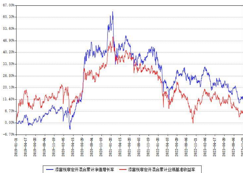
添富悦享定开混合累计净值增长率与同期业绩基准收益率对比图

注：本基金建仓期为本《基金合同》生效之日（2019 年 01 月 31 日）起 6 个月，建仓期结束时各项资产配置比例符合合同约定。