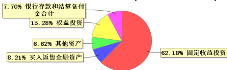
投资组合资产配置图表(2023年12月31日)

● 固定收益投资 ● 买入返售金融资产 ● 其他资产 ● 权益投资 ● 银行存款和结算备付金合计