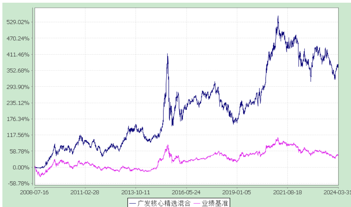
广发核心精选混合型证券投资基金 份额累计净值增长率与业绩比较基准收益率历史走势对比图 (2008年7月16日至2024年3月31日)