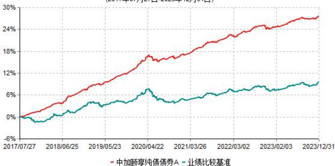
中加颐享纯债债券A累计净值增长率与业绩比较基准收益率历史走势对比图 (2017年07月27日-2023年12月31日)