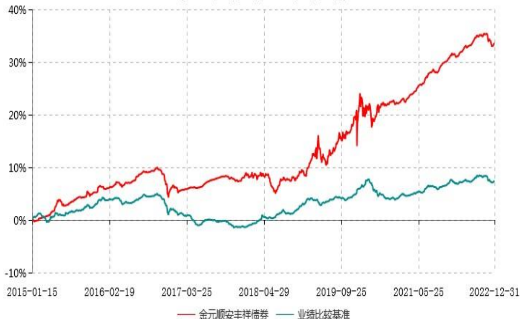
金元顺安丰祥债券型证券投资基金累计净值增长率与业绩比较基准收益率历史走势对比图 (2015年01月14日-2022年12月31日)