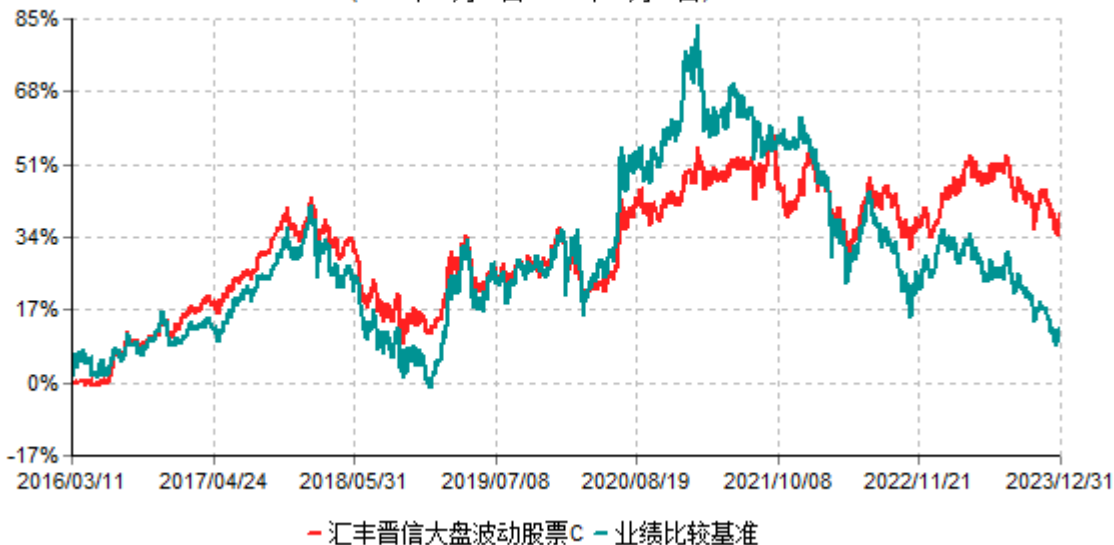
汇丰晋信大盘波动股票C累计净值增长率与业绩比较基准收益率历史走势对比图 (2016年03月11日-2023年12月31日)