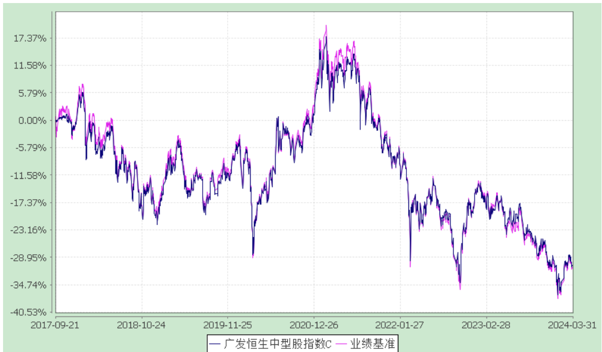
广发恒生中型股指数 (LOF) E