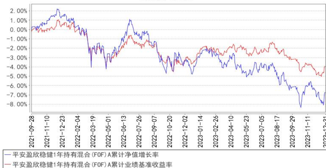
平安盈欣稳健1年持有混合(FOF)A累计净值增长率与同期业绩比较基准收益率的历史走势对比图