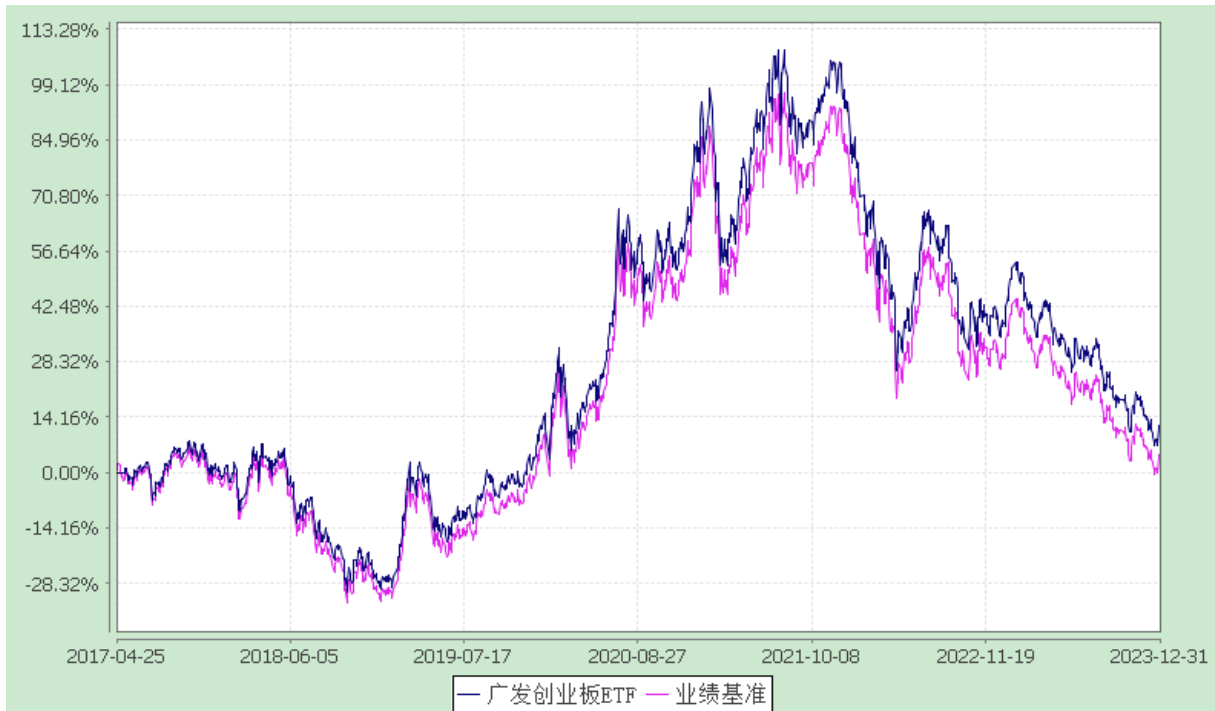
广发创业板交易型开放式指数证券投资基金 份额累计净值增长率与业绩比较基准收益率的历史走势对比图 (2017年4月25日至2023年12月31日)