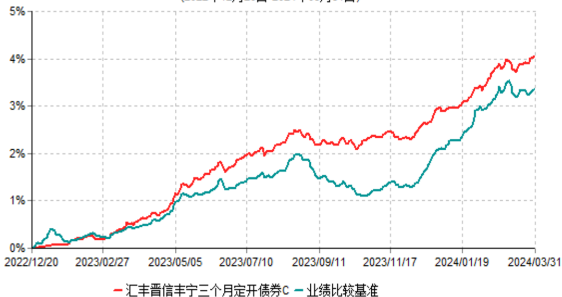
汇丰晋信丰宁三个月定开债券C累计净值增长率与业绩比较基准收益率历史走势对比图 (2022年12月20日-2024年03月31日)