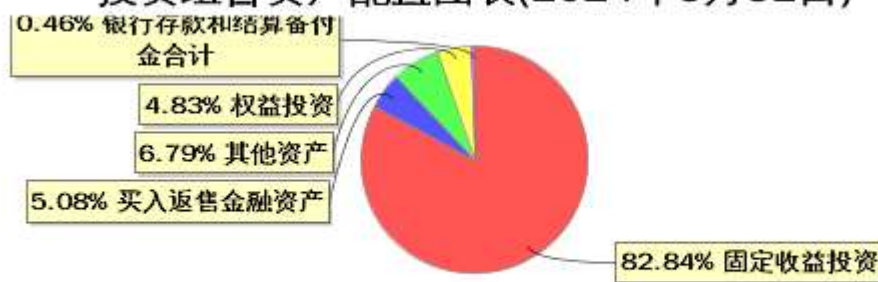
投资组合资产配置图表(2024年3月31日)

● 固定收益投资 ● 买入返售金融资产 ● 其他资产 ● 权益投资 ● 银行存款和结算备付金合计