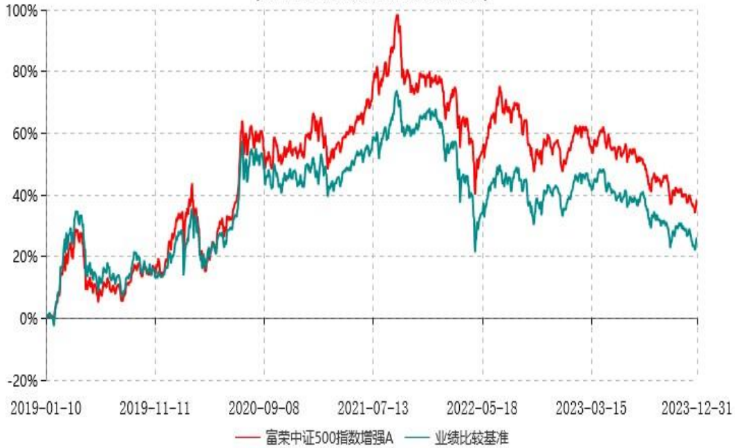
富荣中证500指数增强C累计净值增长率与业绩比较基准收益率历史走势对比图