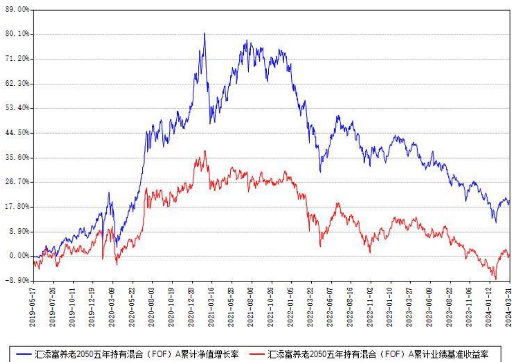
汇添富养老2050五年持有混合 (FOF) A累计净值增长率与同期业绩基准收益率对比图

(二)自基金合同生效以来基金累计净值增长率变动及其与同期业绩比较基准收益率变动的比较图