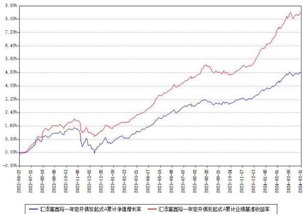
汇添富鑫裕一年定开债发起式A累计净值增长率与同期业绩基准收益率对比图