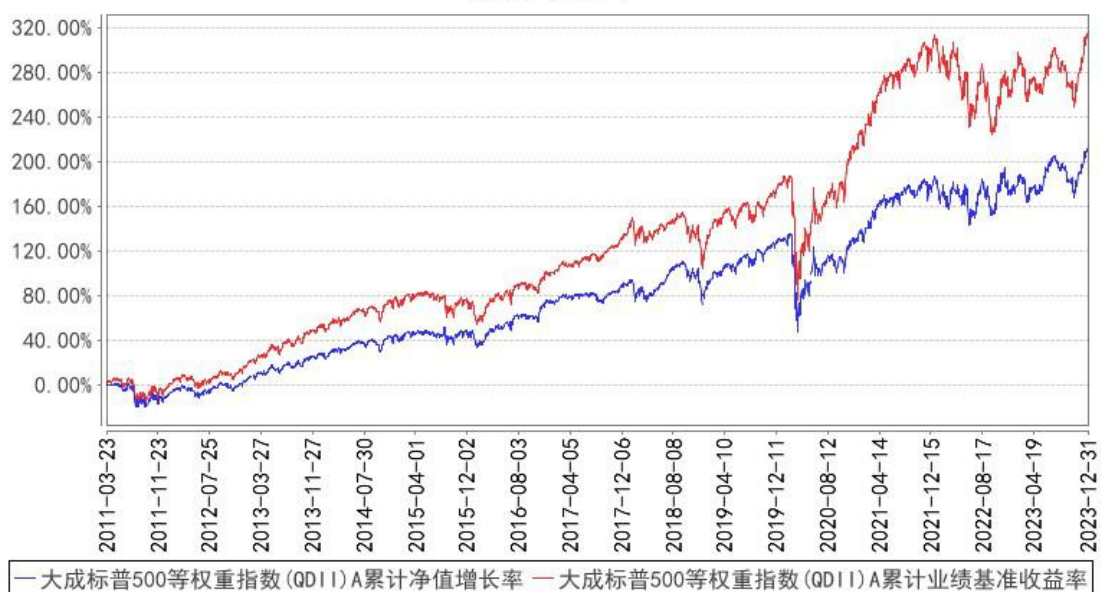
大成标普500等权重指数(QDII)A累计净值增长率与同期业绩比较基准收益率的历史走势对比图

(二) 自基金合同生效以来基金份额累计净值增长率变动及其与同期业绩比较基准收益率变动的比较