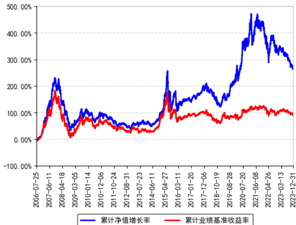
南方稳健成长贰号混合累计净值增长率与同期业绩比较基准收益率的历史走势对比图