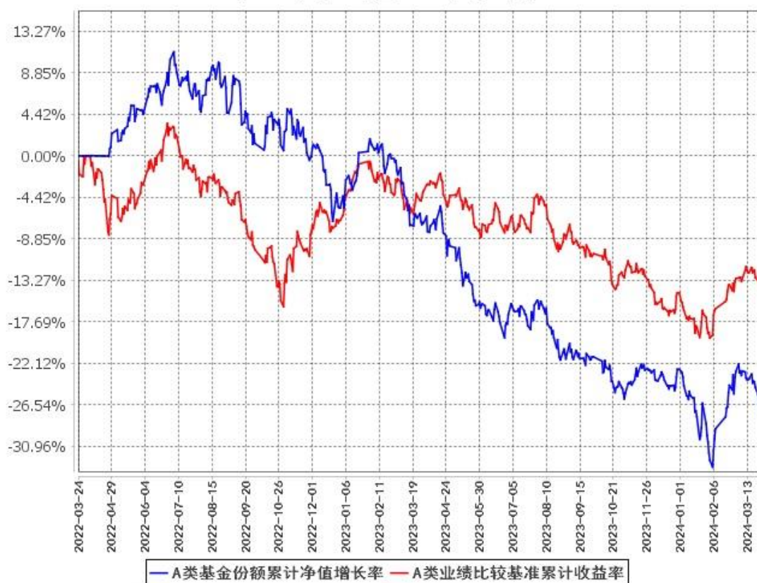
A类基金份额累计净值增长率与同期业绩比较基准收益率的历史走势对比图 (2022年3月24日至2024年3月31日)