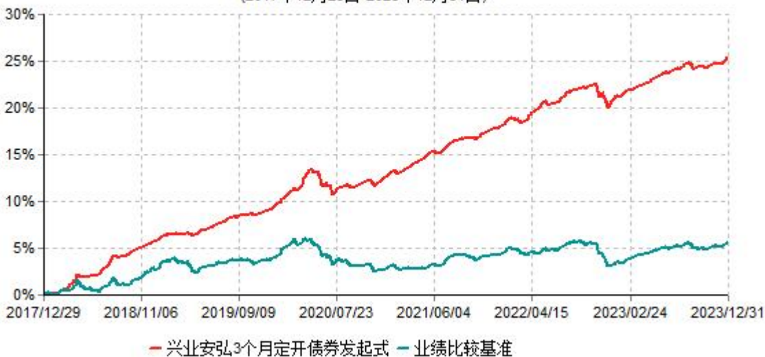
兴业安弘3个月定期开放债券型发起式证券投资基金累计净值增长率与业绩比较基准收益率 历史走势对比图 (2017年12月29日-2023年12月31日)