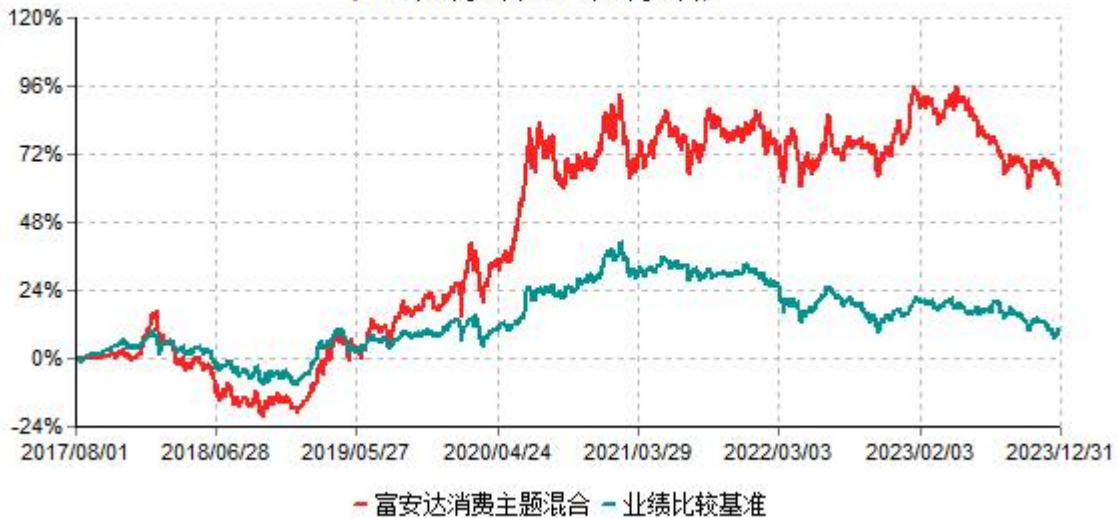
富安达消费主题灵活配置混合型证券投资基金累计净值增长率与业绩比较基准收益率历史走势对比图 (2017年08月01日-2023年12月31日)

注：本基金原业绩比较基准为：沪深300指数收益率*60%+中债总指数收益率*40%，修订后的业绩比较基准为：中证内地消费主题指数*60%+中债总指数收益率*40%，修改后的业绩比较基准生效日为2023年7月25日。