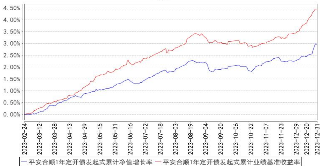
平安合顺1年定开债发起式累计净值增长率与同期业绩比较基准收益率的历史走势对比图

注：1、本基金基金合同于 2023 年 02 月 24 日正式生效，截至报告期末未满一年；