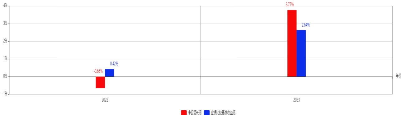
基金每年的净值增长率及与同期业绩比较基准的比较图