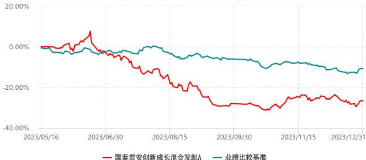
国泰君安创新成长混合发起A累计净值增长率与业绩比较基准收益率历史走势对比图 (2023年05月16日-2023年12月31日)

注：本基金合同生效日为 2023 年 5 月 16 日，截至本报告期末基金合同生效不满一年。