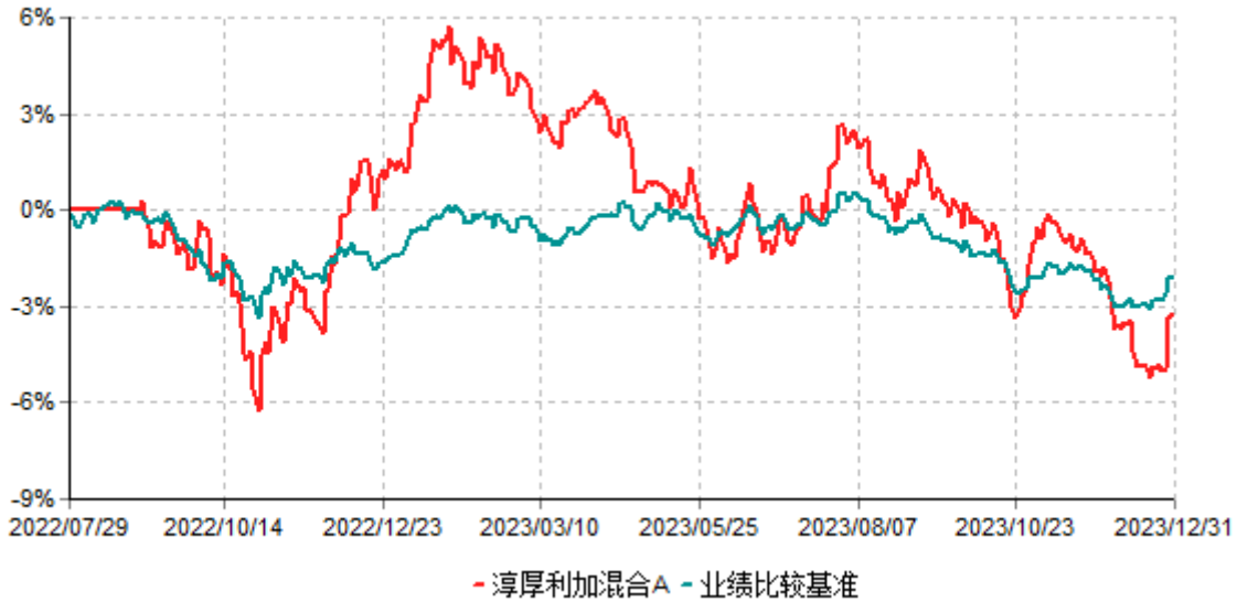
淳厚利加混合A累计净值增长率与业绩比较基准收益率历史走势对比图 (2022年07月29日-2023年12月31日)

注：本基金基金合同生效日为2022年07月29日。按基金合同规定，本基金自基金合同生效起6个月内为建仓期。建仓期结束时本基金的各项投资比例均符合基金合同约定。