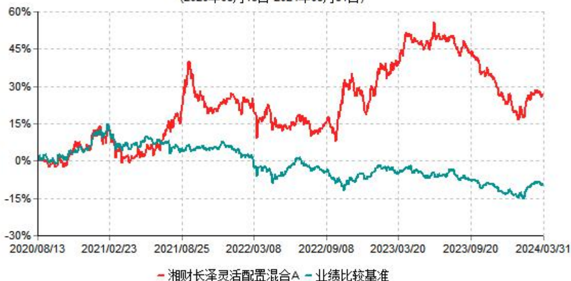
湘财长泽灵活配置混合A累计净值增长率与业绩比较基准收益率历史走势对比图 (2020年08月13日-2024年03月31日)