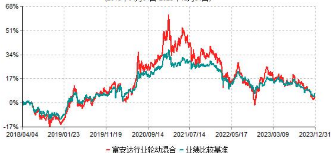
富安达行业轮动灵活配置混合型证券投资基金累计净值增长率与业绩比较基准收益率历史走势对比图 (2018年04月04日-2023年12月31日)