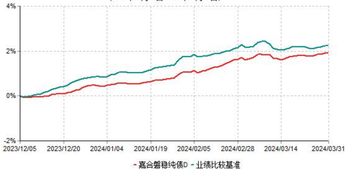
嘉合磐稳纯债D累计净值增长率与业绩比较基准收益率历史走势对比图 (2023年12月05日-2024年03月31日)

注：本基金于 2023 年 12 月 05 日增设 D 类基金份额，D 类基金份额实际存续从 2023 年 12 月 05 日开始。