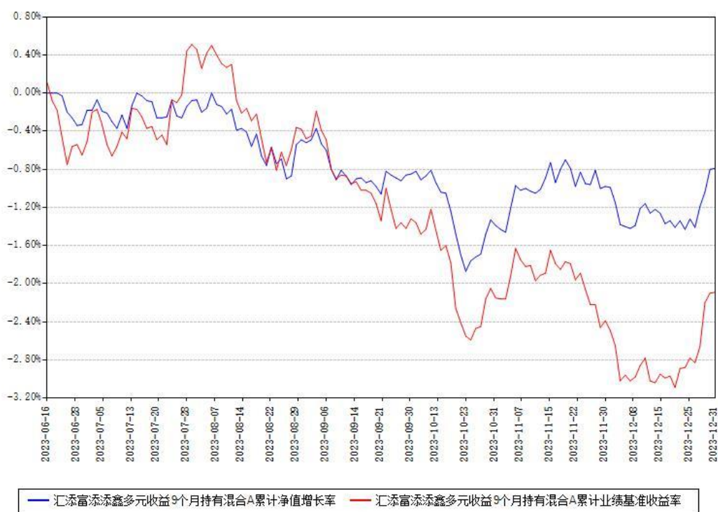
汇添富添添鑫多元收益9个月持有混合A累计净值增长率与同期业绩比较基准收益率对比图