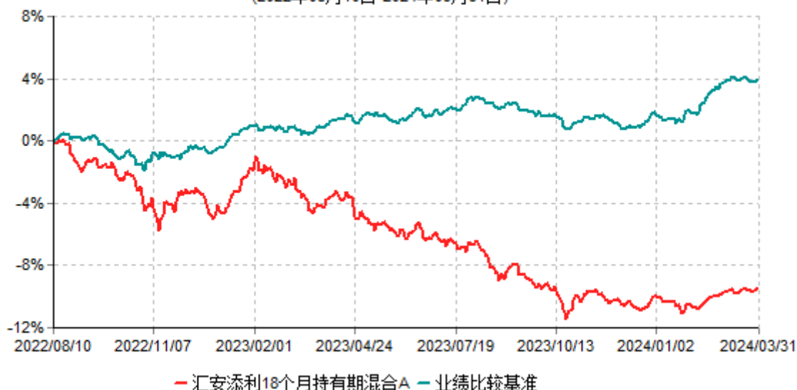
汇安添利18个月持有期混合A累计净值增长率与业绩比较基准收益率历史走势对比图 (2022年08月10日-2024年03月31日)