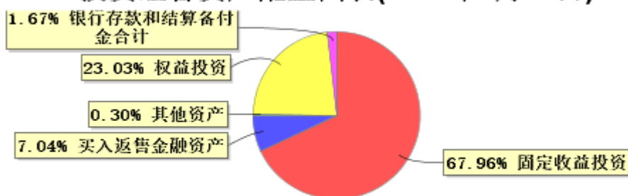
投资组合资产配置图表(2024年3月31日)

● 固定收益投资 ● 买入返售金融资产 ● 其他资产 ● 权益投资 ● 银行存款和结算备付金合计