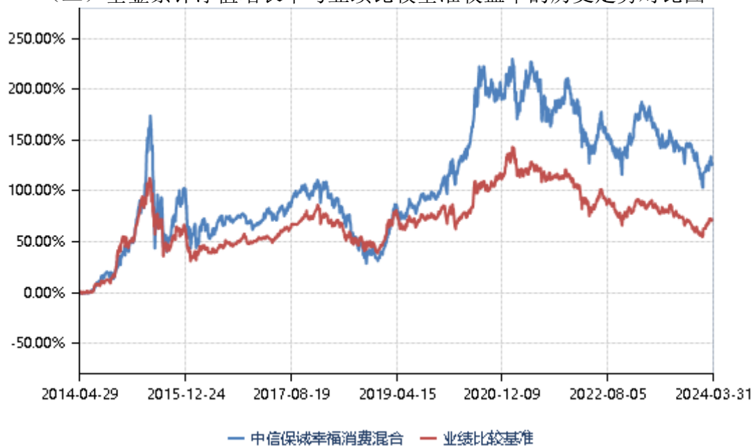
(二) 基金累计净值增长率与业绩比较基准收益率的历史走势对比图