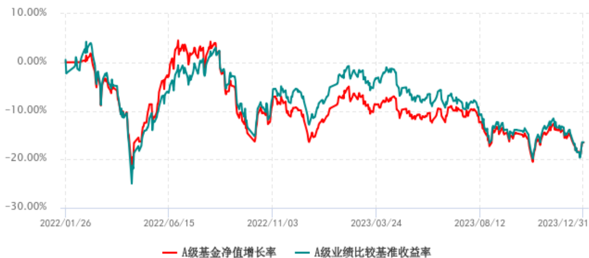
A 级基金份额累计净值增长率与同期业绩比较基准收益率历史走势对比图 (2022 年 01 月 26 日-2023 年 12 月 31 日)