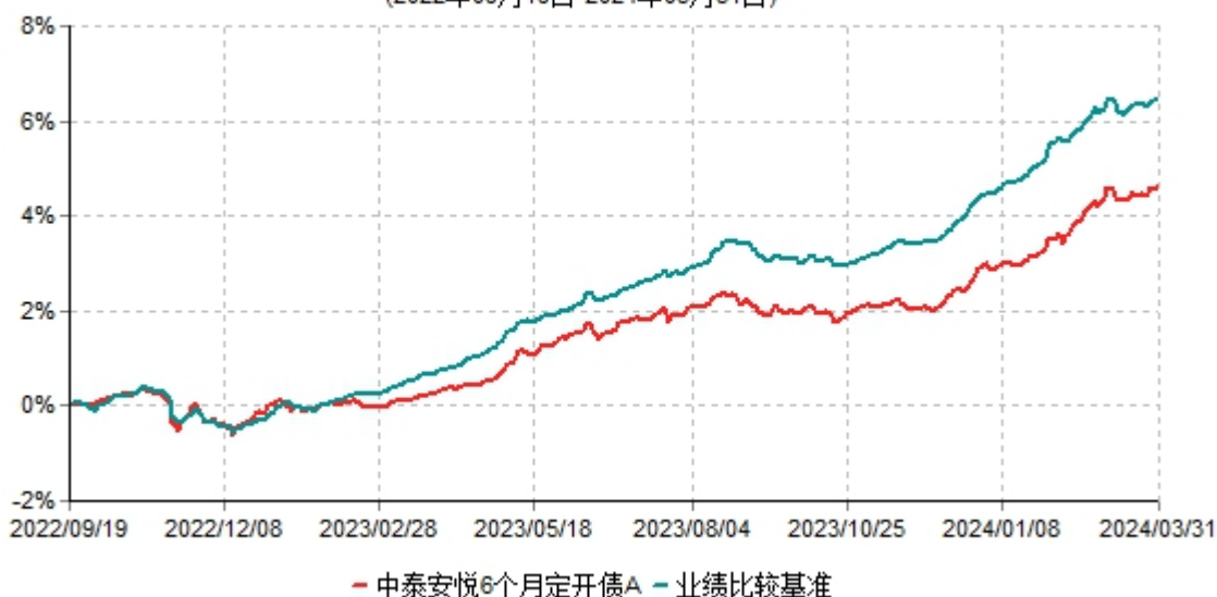
中泰安悦6个月定开债A累计净值增长率与业绩比较基准收益率历史走势对比图 (2022年09月19日-2024年03月31日)