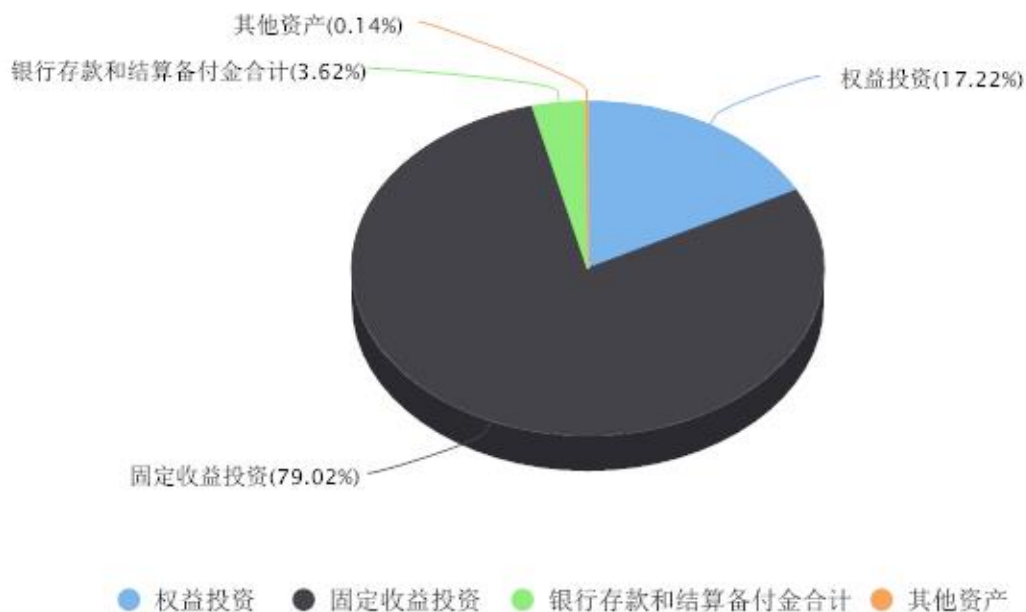
投资组合资产配置图表 数据截止日期:2024年03月31日