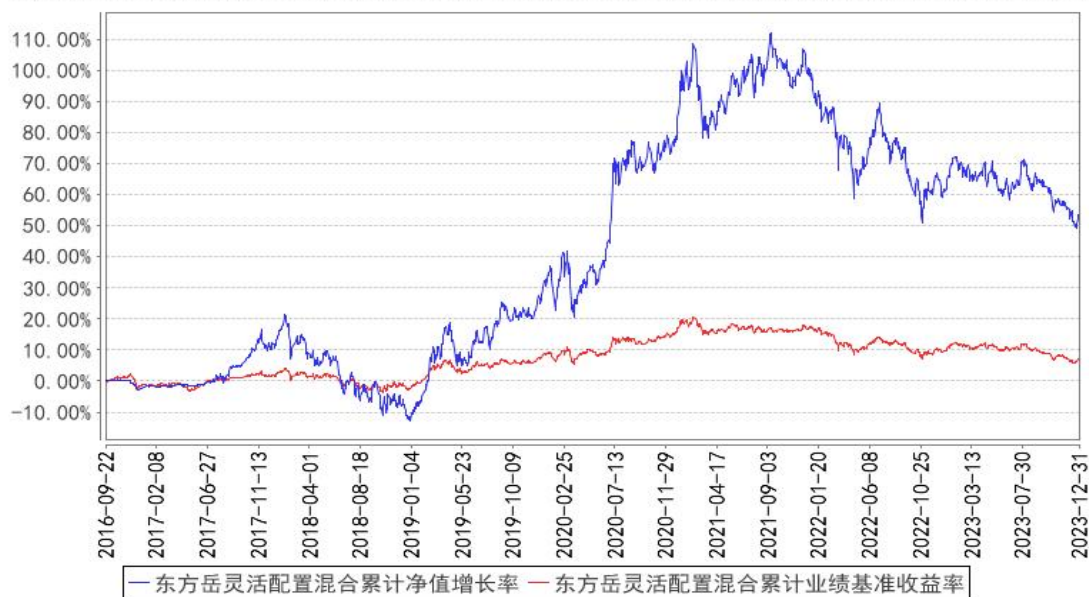
东方岳灵活配置混合累计净值增长率与同期业绩比较基准收益率的历史走势对比图