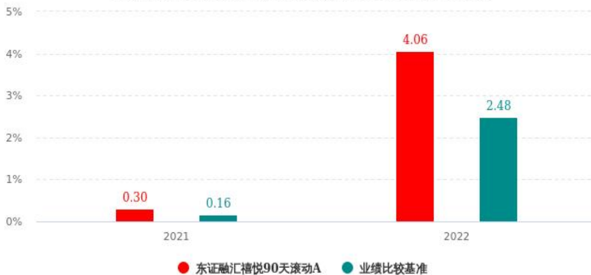
基金的过往业绩不代表未来表现，数据截止日：2022年12月31日