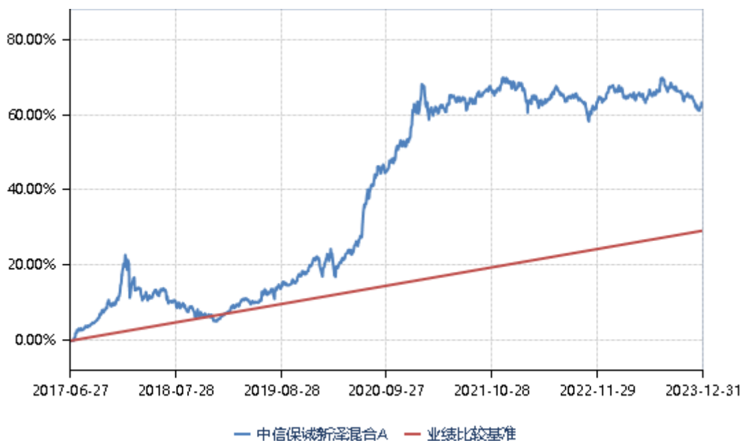
中信保诚新泽混合 B