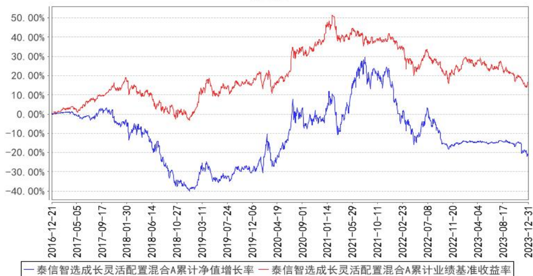
泰信智选成长灵活配置混合A累计净值增长率与同期业绩比较基准收益率的历史走势对比图