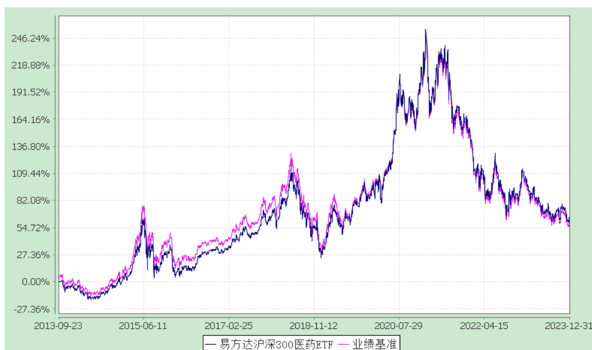
易方达沪深 300 医药卫生交易型开放式指数证券投资基金 份额累计净值增长率与业绩比较基准收益率历史走势对比图 (2013 年 9 月 23 日至 2023 年 12 月 31 日)

注：自基金合同生效至报告期末，基金份额净值增长率为 64.60%，同期业绩比较基准收益率为 60.32%。