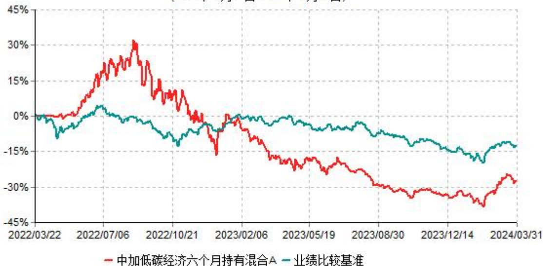
中加低碳经济六个月持有混合A累计净值增长率与业绩比较基准收益率历史走势对比图 (2022年03月22日-2024年03月31日)